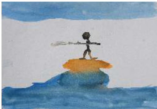
Madalena Blanc - O Sonho do Surfista Aguarela s/papel, 4º A

Trabalhar com aguarelas é sempre uma ótima experiência para professores e alunos, é um material delicado, mágico com grande potencialidade, que nos permite voar para além da nossa imaginação.