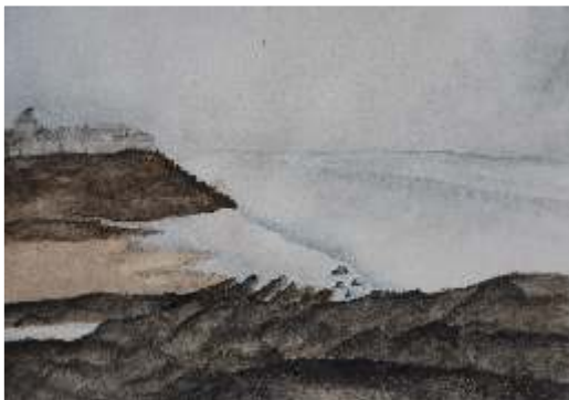
Catarina da Mota - Mar de Inverno Aquarela s/papel, 10º E

O tema e a técnica propostos despertaram sentimentos opostos. A experiência com a aquarela era muito reduzida, porém a relação com o tema era diária. O desafio centrou-se na compreensão de que em ambas as condicionantes a relação com a água seria a questão central. Nas aquarelas, o domínio estava na capacidade de lidar com a água e a sua mistura com a tinta. A água foi, também, protagonista enquanto temática - a presença da água do mar e a sua relação com o envolvente.