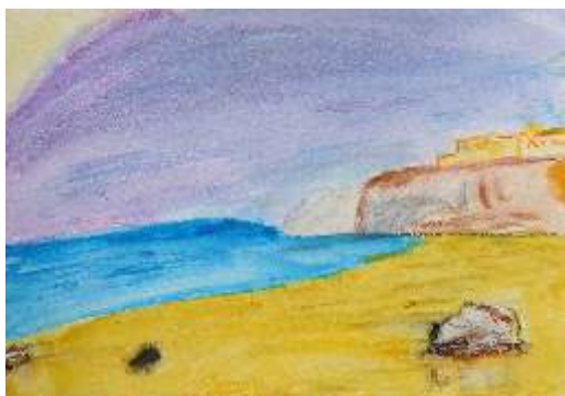
Luka Lukic - Praia do Guincho Aguarela s/papel, 4ºH

De entre as imagens disponibilizadas na sala de aula, a praia do Guincho e Fortaleza do Guincho foram as paisagens que os alunos escolheram para inspirar as suas aguarelas.