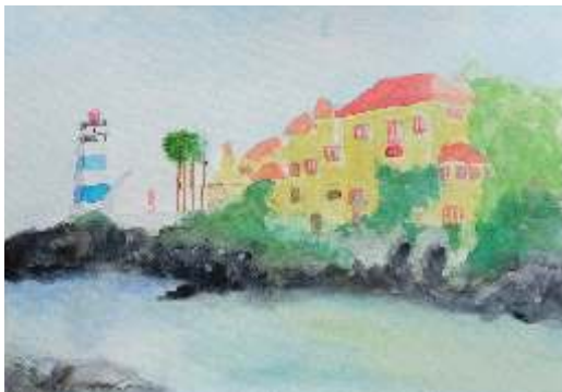
Rute Saraiva - Antes da Tempestade Aguarela s/papel, 10º A1

Trabalhar com aguarelas foi uma experiência muito agradável. A aguarela com água é livre. Gostei muito.