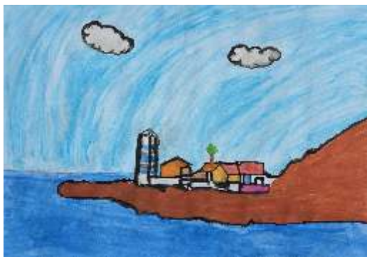
Bianca Riquicho - Baía de Cascais Aguarela s/papel, 4ºD

Todos os alunos demonstraram bastante interesse na segunda participação da nossa Escola neste projeto. Além de ser uma motivação poderem ser selecionados para a exposição final, o facto de estarem a representar em aguarela as paisagens magníficas da sua terra fez com que todos quisessem dar o seu máximo. É uma experiência bastante enriquecedora que naturalmente será para repetir no futuro.