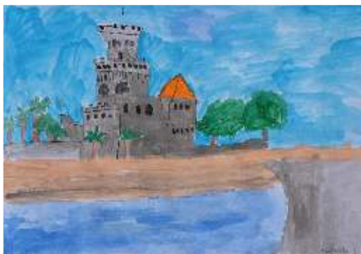
Margarida Leandro - A Praia do Tamariz Aguarela s/papel, 2ºA

É um prazer para cada aluno experimentar pintar com aguarela, sendo sempre uma experiência quase mágica. Os alunos tiram partido da plasticidade do material e experimentam com gosto a mistura de tintas. Participar no concurso é uma boa oportunidade para os alunos verem os seus trabalhos expostos e partilharem a experiência com alunos de outras escolas.