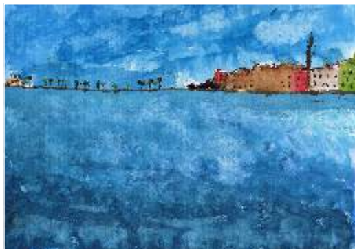
Pedro Balsemão - Dois céus, dois mares. Aguarela s/papel, 5º Ano

A baía de Cascais recebeu-nos algo cinzenta, mas não menos acolhedora. Durante a manhã, pudemos redescobrir os seus traços mais distintivos – a linha de água e a arquitetura circundante. Explorámo-los, através do desenho à vista e posteriormente em sala de aula.