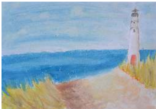
Yijin Wang - Mar Salgado Aguarela s/papel, 6º B

Os alunos aceitaram este desafio com muito entusiasmo. A participação neste concurso, permitiu explorarem as técnicas básicas da aguarela e promoveu a capacidade de representação e observação.